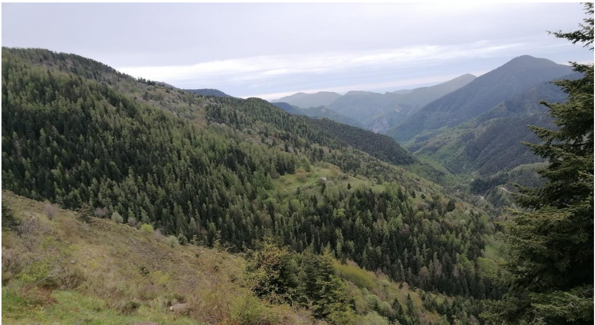
Photo 2. Vallée de la Bévère.