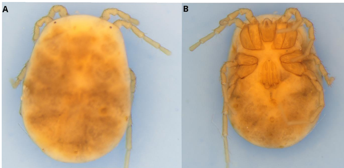
Figure 1. Vue dorsale (A) et vue ventrale (B) d'une femelle de Tartarothyas romanica .