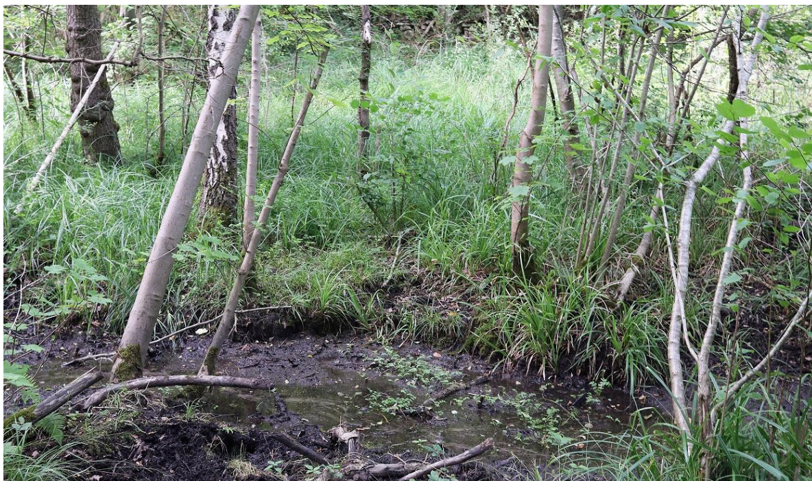
Figure 2. Station de capture d' Erioptera ( Erioptera ) limbata Loew, 1873 au sein de l'ENS du Moulin Neuf, commune de Saint-Martin-du-Tertre, département du Val-d'Oise.

Figure 1. Erioptera ( Erioptera ) limbata Loew, 1873, male terminalia (specimen collected in the 'Moulin Neuf' sensitive natural area (Saint-Martin-du-Tertre, Val d'Oise). Scale line: 0,2 mm.