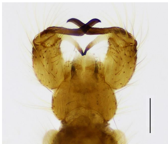
Figure 1. Erioptera ( Erioptera ) limbata Loew, 1873, terminalia mâle (spécimen capturé dans l'ENS du Moulin Neuf, Saint-Martin-du-Tertre). Barre d'échelle : 0,2 mm.

Cette observation constitue la première mention d' Erioptera ( Erioptera ) limbata pour la France. Cette découverte dans notre pays n'est pas surprenante, s'inscrivant logiquement dans une vaste aire de répartition européenne. Erioptera ( Erioptera ) limbata ayant été précédemment