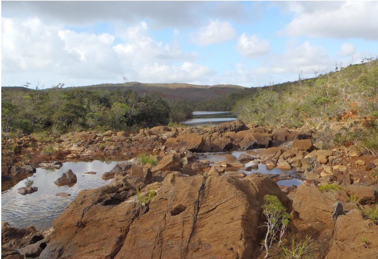
Photo 1. Une des nombreuses stations de collectes de Chironomidae en Nouvelle-Calédonie : « Kaoris aval ».

Keywords: faunal list, adults, pupae, pupal exuviae, ecological zones, Oceania