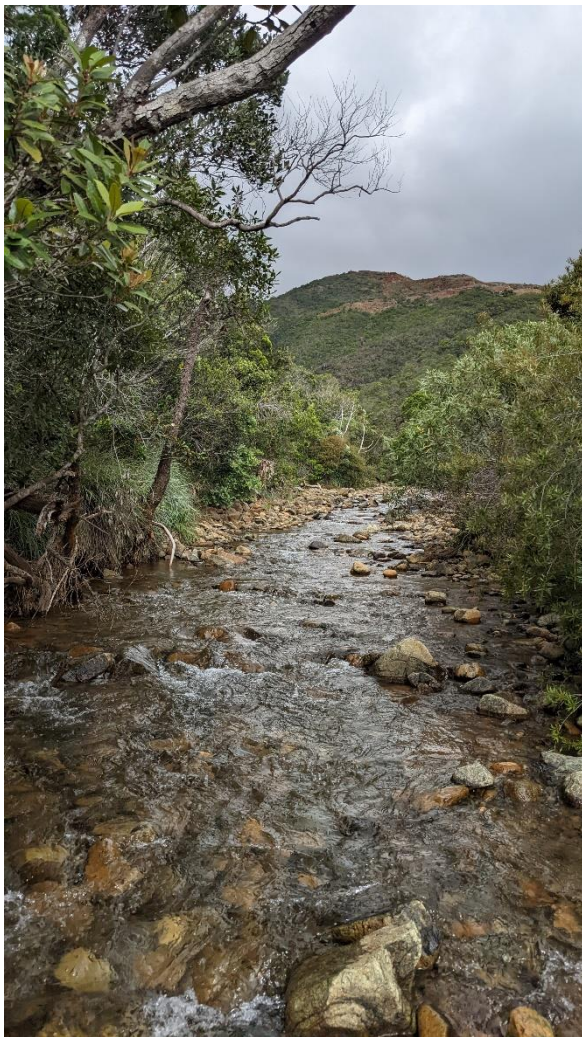
Rivière Wé Injob.

Par ailleurs, quinze espèces appartenant aux genres Allocladius , Orthocladius , Pseudosmittia , Smittia , Thienemanniella et Polypedilum ont déjà fait l'objet de publications (MOUBAYED & MARY 2023a, 2023b, 2023c, 2023d, 2023e, 2023f). Les autres descriptions seront effectuées progressivement.